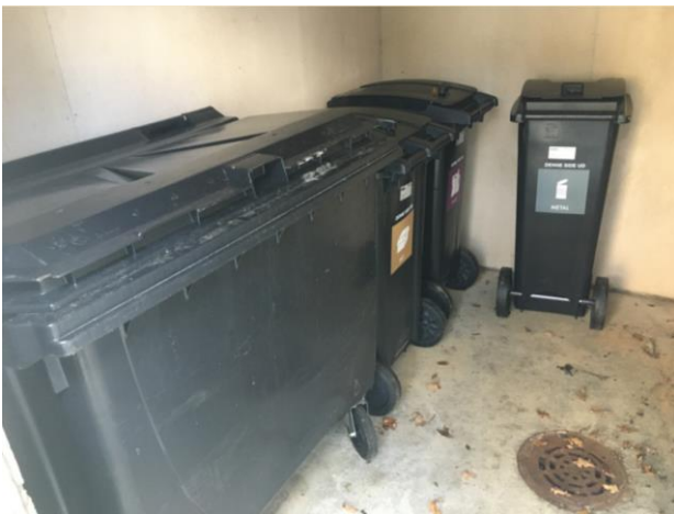
Affaldsskure ved punkthusene

I affaldsskure kan der deponeres Pap, Plast, Mad og Restaffald. Glas, Metal og Papir kan deponeres i de centralt placerede containere ved vaskepladsen og ved containerskur. Se i øvrigt sorteringsvejledningerne på de kommende sider.