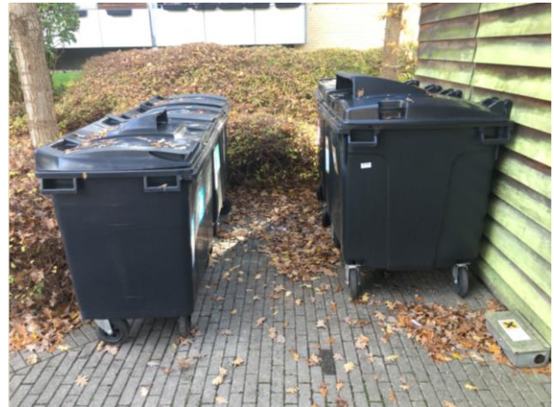
Ved containerskur for enden af vejen.

Her kan man deponere Papir, Glas, Plast, Pap, Metal, Mad og restaffald.